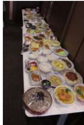
昨年のイベントの様子