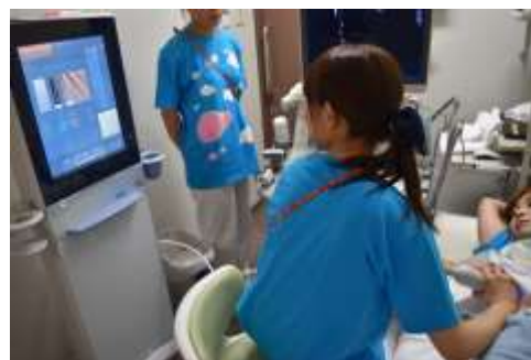
昨年のイベントの様子